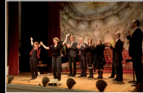
1. Platz der Jury und Publikumspreis beim Potsdamer Chansonfestival 2010